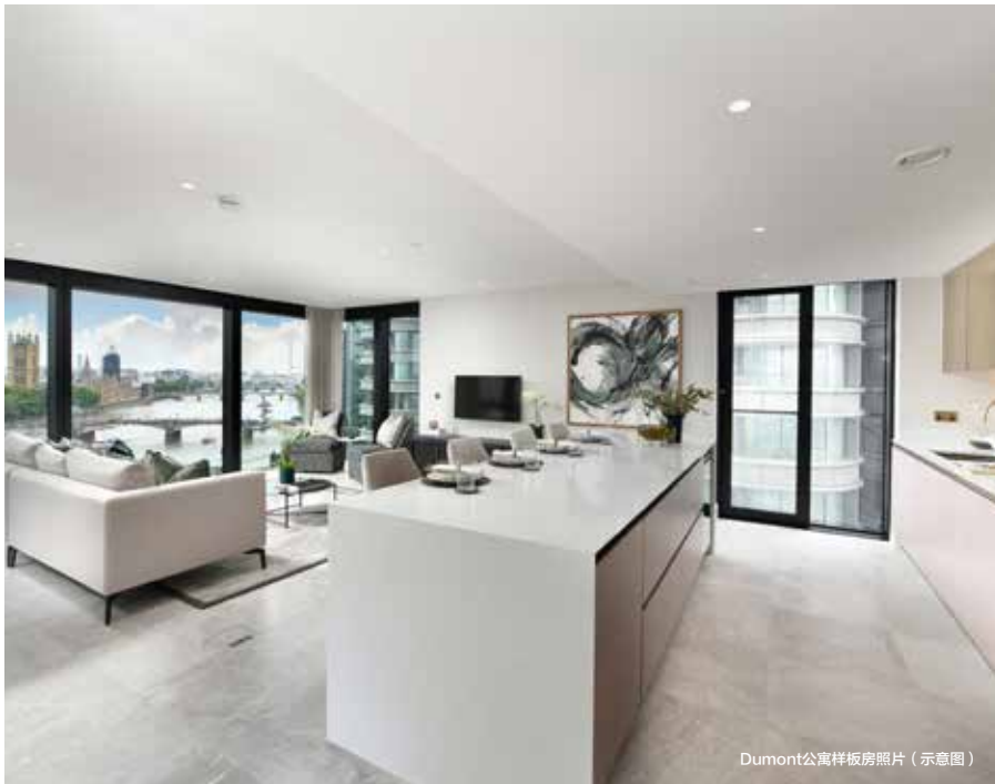
Dumont公寓样板房照片（示意图）